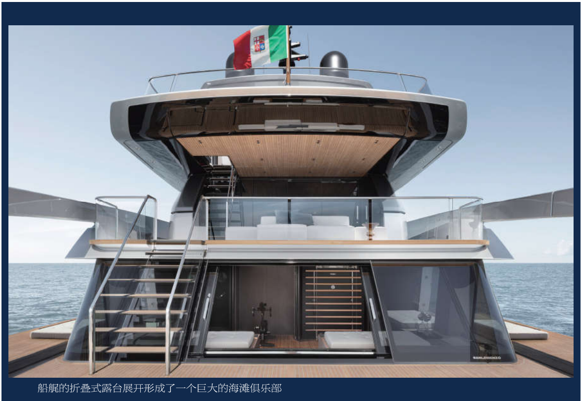
船艏的折叠式露台展开形成了一个巨大的海滩俱乐部