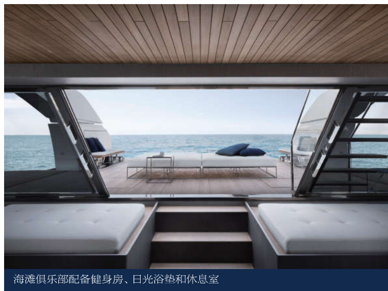
海滩俱乐部配备健身房、日光浴垫和休息室

在SX112 Almax上，下层甲板的船艏部是船主舱。舱内右舷墙上的镜子有双重用途——它增大了室内的空间感，内里还隐藏了一台平板电视；左舷处放置有一张特大号床；前部是浴室套间，装饰着意大利制造的光感绿色大理石，花洒淋浴提供充足的空间，净空高度超过两米。两间VIP舱均设有浴室套间。下层甲板客厅还可转换为一个两人间，当不作为卧室时，此处空间自然光线充足，这要得益