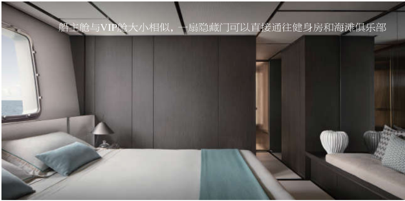
船主舱与VIP舱大小相似，一扇隐藏门可以直接通往健身房和海滩俱乐部